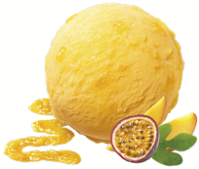
PASSION FRUIT & MANGO