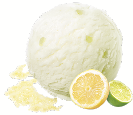
LEMON & LIME